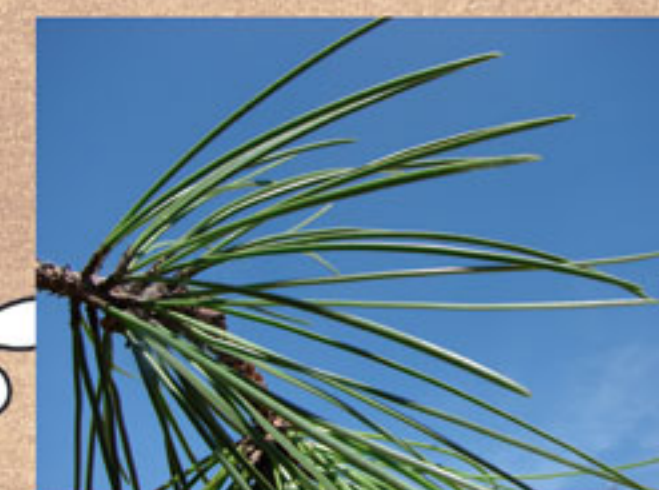
aiguilles de pin maritime

Observez bien l' ..... du pin sylvestre, sa couleur est orangée. Ces aiguilles sont plus petites que celles du pin maritime. Ce pin est l'unique en forêt des Pays de Monts, il se développe en général dans les régions montagneuses.