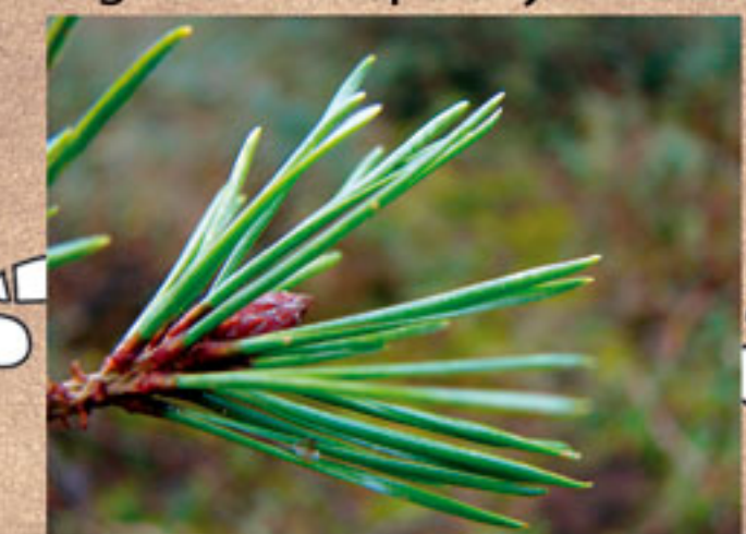
aiguilles de pin sylvestre